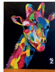
Kiss Lola Virág 8. b

beszerezhető saját készítésű ajándékaink örömet szereznek családtagjainknak, nekünk pedig az alkotás örömét adja, miközben készítjük.